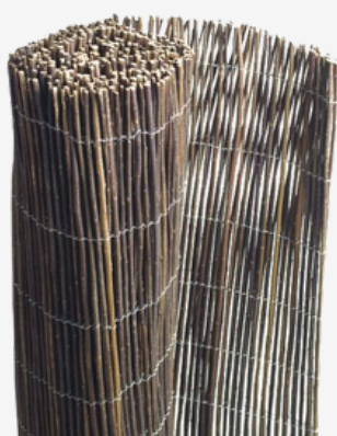
Rouleau de canisse en PVC