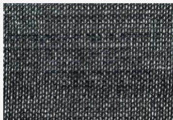
Rouleau de toile pour balcon